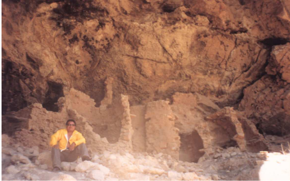
Figura 5 : Cueva N° 1. Tumbas semicirculares, Huichay, Tarma, Junín.