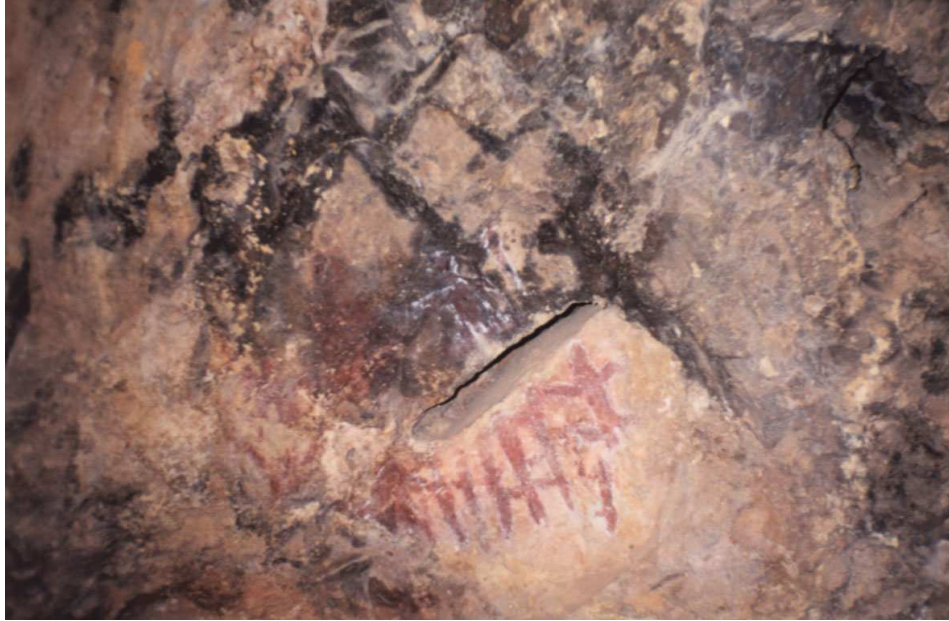
Figura 3 : Cueva N° 1. Antropomorfos estilizados Huichay, Tarma, Junín.