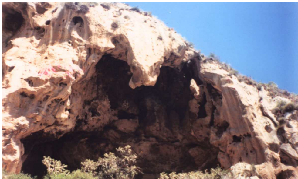
Figura 2 : Entrada a la Cueva N° 1 de Huichay, Tarma, Junín.