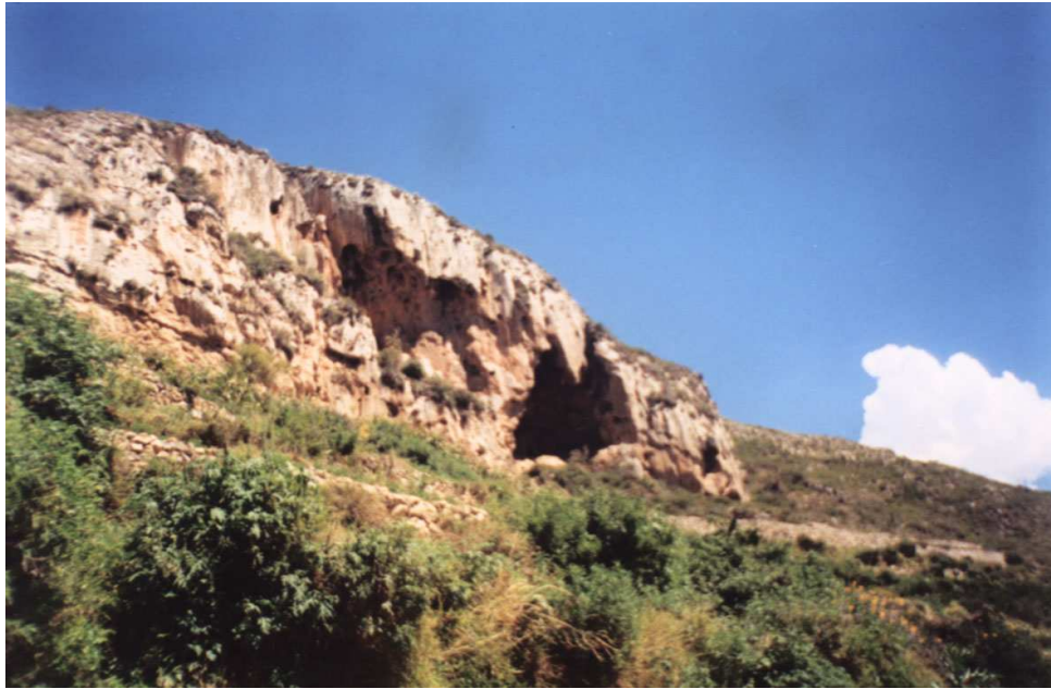
Figura 1 : Cueva N° 1 y terrenos agrícolas Huichay, Tarma, Junín.