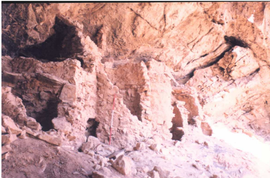
Figura 4 : Cueva N° 1. Tumbas semicirculares Huichay, Tarma, Junín.