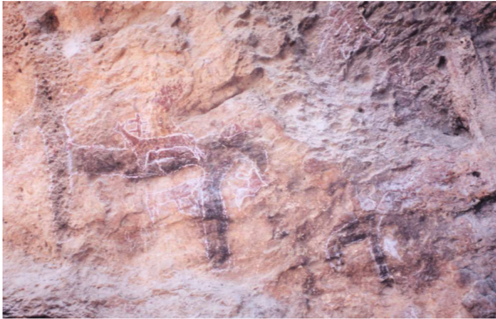
Figura 7 : Cueva N° 2. Camélidos estilizados Huichay, Tarma, Junín.