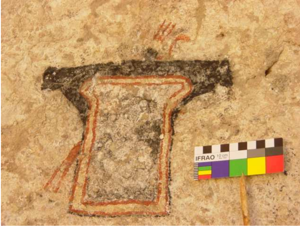
Foto 6 Sector C Unku