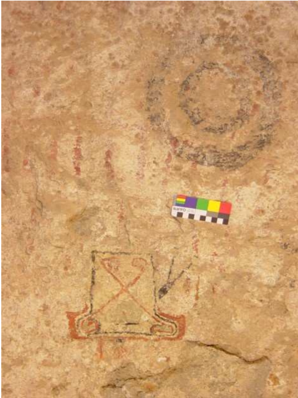
Foto 5 Sector C Unku