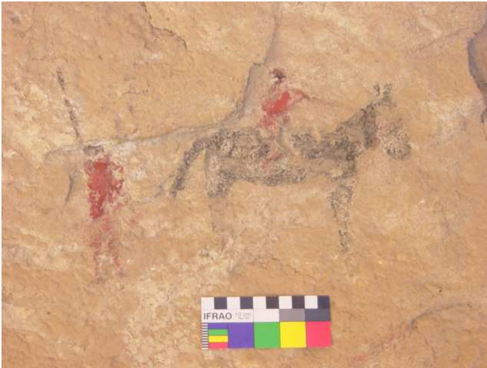
Foto 7 Hombres y jinetes