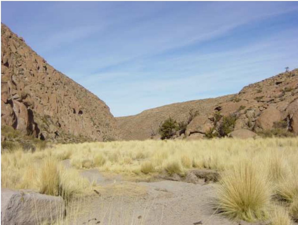
Foto 1 Quebrada de Yugunte