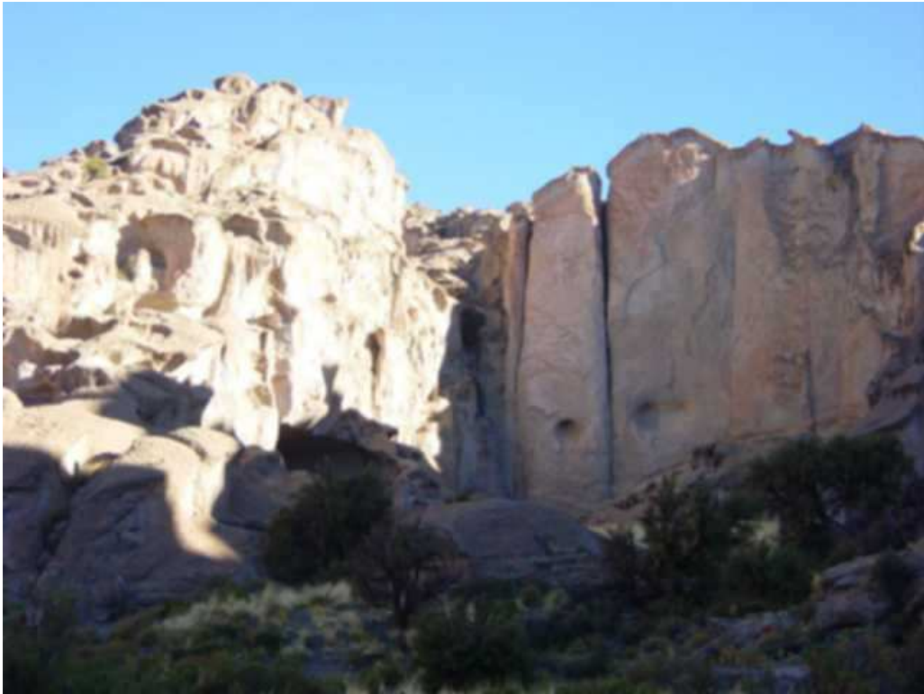
Foto 2. Cueva de Yugunte