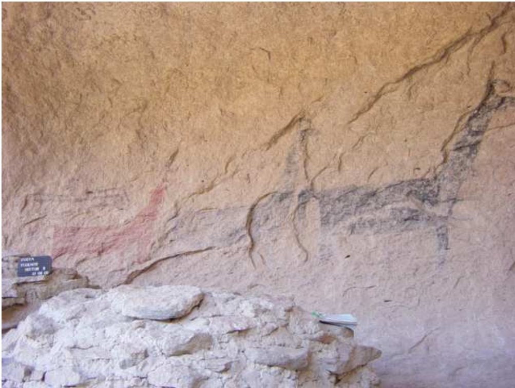
Foto 4 Sector B. Camélidos grandes