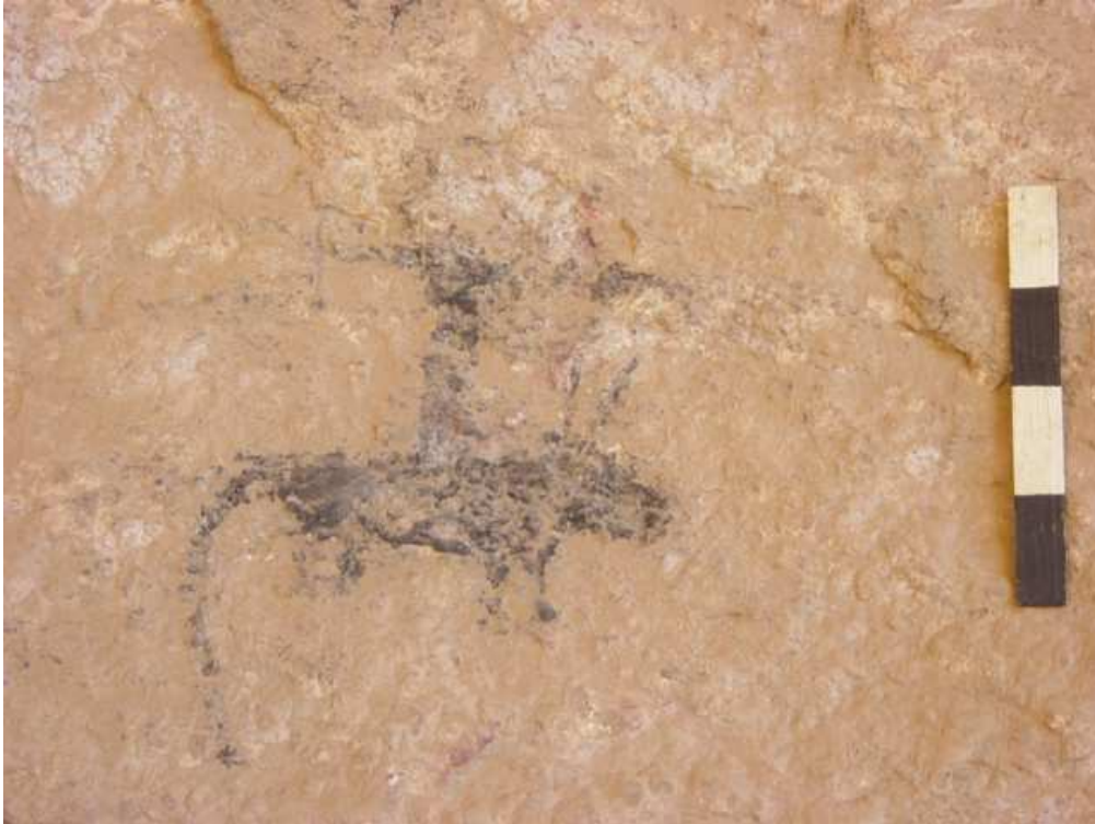
Foto 8 Toro con hombre saltando sobre él