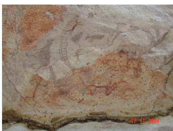
Caza de mastodontes