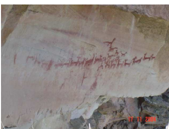
Domesticación de camélidos